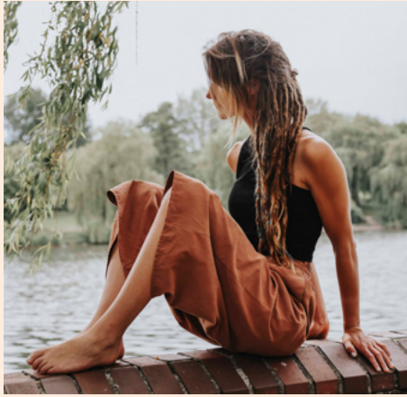
The BlueBird Orchestra