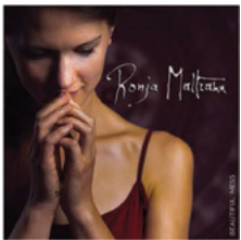
Beautiful Mess 2018 | TIMEZONERECORDS